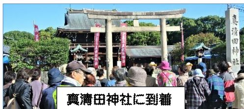
真清田神社に到着