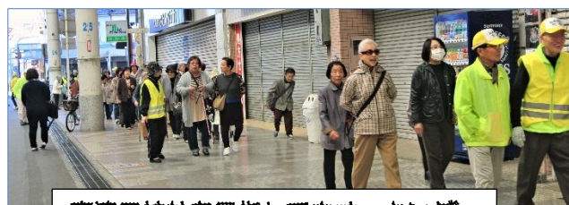
真清田神社を目指してウォーキング