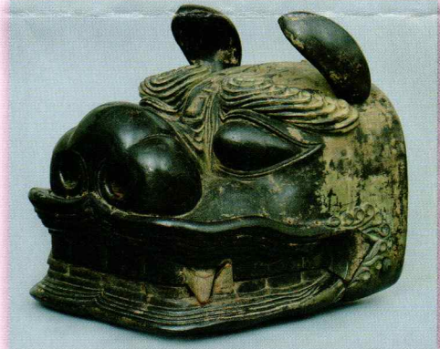
⑤愛知県指定文化財 獅子頭 文明3年(1471)