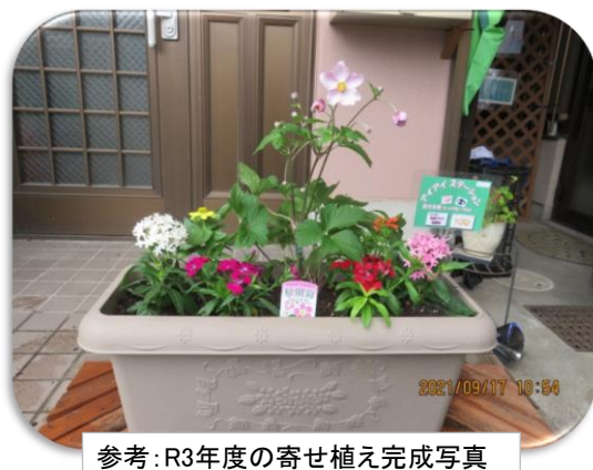
参考: R3年度の寄せ植え完成写真