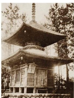
【焼失した国宝・多宝塔】

神亀年間行基の創建、弘仁年中(810-823)弘法大師が伽藍を整備したと伝えられる。文永年中(1264~)空円上人が再興、10坊を構えた。室町期の建立とされ、明治34年に旧国宝に指定された多宝塔は、昭和8年に焼失した。昭和20年空襲により本堂なども焼失している。本尊は十一面観音。