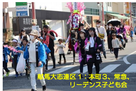
献馬大志連区1：本町3、常念、リーダンス子ども会