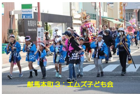
献馬本町3：エムズ子ども会