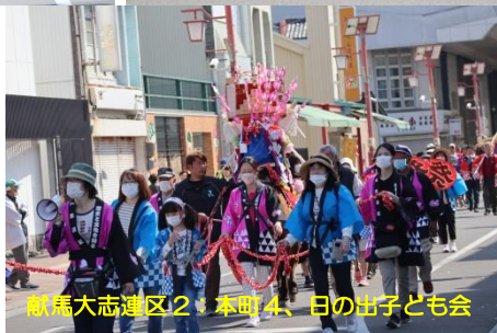
献馬大志連区2：本町4、日の出子ども会