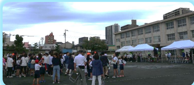
【雨模様の中の開会式】

10月1日(日)、コロナやインフルエンザなどの感染症の心配もありましたが、係・役員さん方のお骨折りで、準備は万端。あとは本番を待つだけでしたが、前日の見事な『中秋の名月』とは裏腹に、あいにくの雨。「運動会をやりたい!」との子どもたちの願いもむなしく、開会式のみ開催となりました。