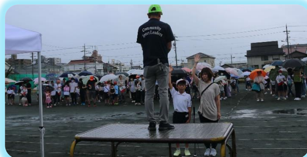
【雨の中の「選手宣誓」】