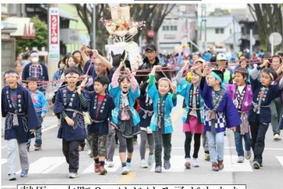
献馬：本町3：はじける子どもたち