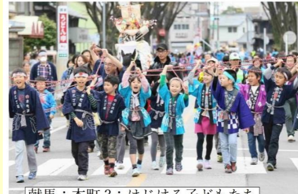
献馬：本町3：はじける子どもたち