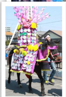
似顔絵飾りの献馬